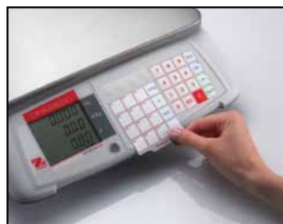
Wymienna karta z ustawieniami