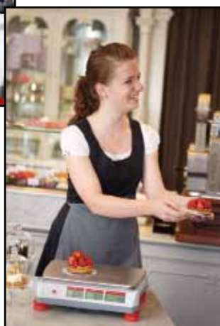
Sklep ze słodyczami