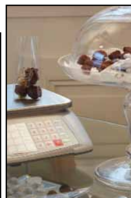
Ciastka, herbata, czekolada