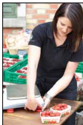
Łatwa regulacja stopek