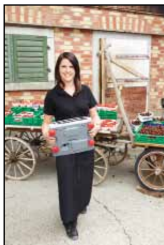
Łatwe przenoszenie dzięki dwóm uchwytom na spodzie wagi