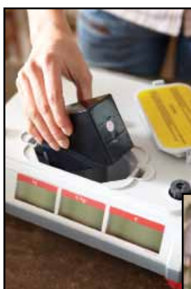
Mobilny biznes na zasilaniu bateryjnym