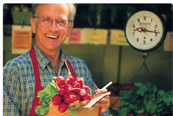
Bazary, stoiska, sprzedaż mobilna