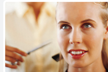
Salony fryzjerskie i kosmetyczne

EURO-50TE Mini to najmniejsza przenośna kasa EURO z kopią elektroniczną przeznaczona do punktów sprzedaży i usług o małym natężeniu ruchu oraz do sprzedaży mobilnej. Duże klawisze i proste programowanie zapewniają komfort obsługi. Nowoczesny i elegancki wygląd przy niewielkich wymiarach to dodatkowy atut kasy.