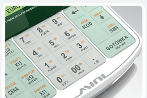
14 klawiszy szybkiej sprzedaży