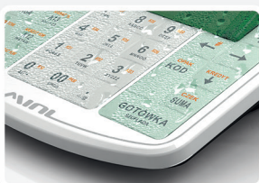
Wodoodporna i wygodna klawiatura