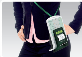
Pełna mobilność; obsługa usług parkingowych.