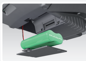
Wydajny akumulator Li- ION, ponad 30 000 linii wydruku