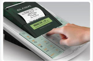
Duży i czytelny wyświetlacz alfanumeryczny operatora