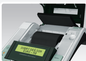
"Wrzuć i pracuj" i 25 metrowa rolka papieru