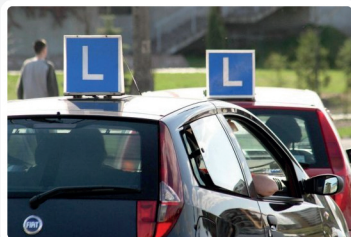
Szkoły nauki jazdy